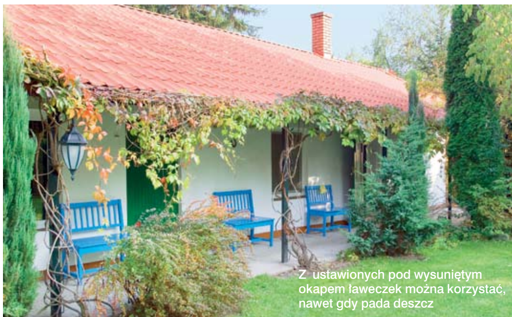
Z ustawionych pod wysuniętym okapem ławeczek można korzystać, nawet gdy pada deszcz

kuchnia dla cateringu oraz toalety. Wymieniono też instalację wodną i elektryczną. Gospodarstwo ma własne ujęcie wody, studnię głębokości 28 metrów. Konieczne było wykonanie posadzek. Ze względów praktycznych pani Joanna zdecydowała się na terakotę, a w sali ludowej na cegłę odpadową, przepaloną kupowaną po 5 groszy za sztukę. Tworzy ona klimat starego osadzonego w otoczeniu wnętrza.